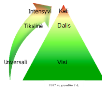
I pav. Trijų pakopų prevencijos logika (piramidė)