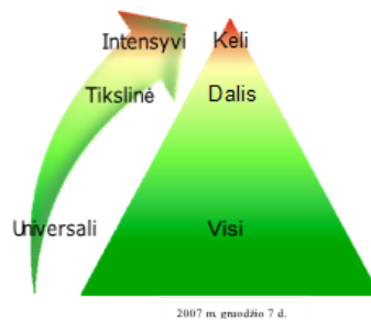
I pav. Trijų pakopų prevencijos logika (piramidė)